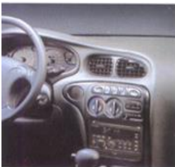
自動車 In Panel